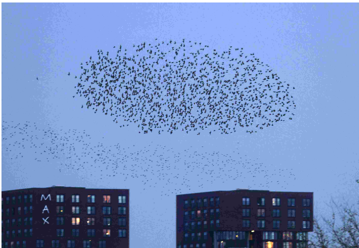
Figuur 2 Een zwerm vogels boven Kanaleneiland. 8

Het Huis van Dominicus wil een plaats zijn waar te zien en te merken is hoe de Geest mensen in beweging brengt, waar wordt begrepen dat we elkaar tot steun kunnen zijn en waar aandacht is voor elkaars wel en wee. Wij leggen ons erop toe om van het Huis van Dominicus een werkplaats van hoop te maken die bijdraagt aan 'goed leven voor allen'.