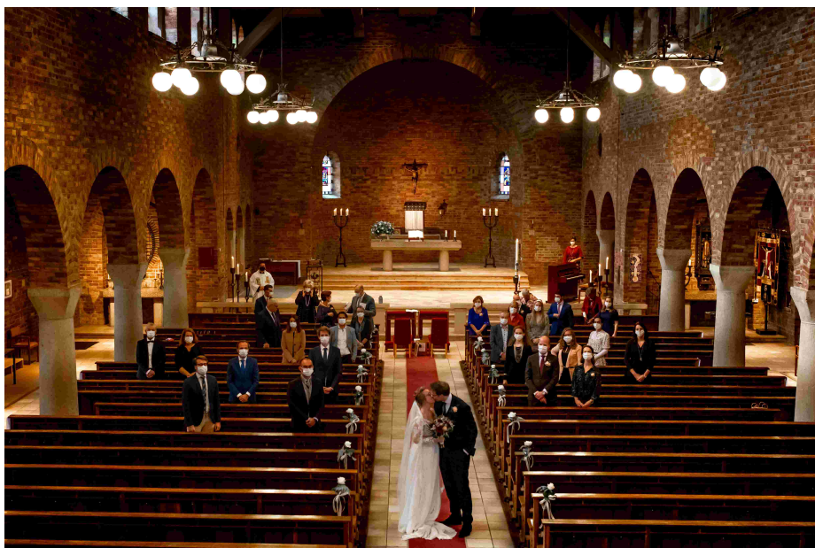
Figuur 1. Huwelijksinzegening in de kerk met maximaal 30 personen op anderhalve meter afstand

Vanwege de steeds veranderende maatregelen is er veel tijd gaan zitten in communicatie met vaste en incidentele huurders en interne gebruikers van de ruimtes. Iedereen wilde weten wat er wel en niet kon. Soms waren de regels wat versoepeld en werd de beschikbare ruimte zo goed mogelijk verdeeld, dan moest alles weer stopgezet worden. Van buiten kwamen er veel aanvragen van koren en andere groepen die op zoek waren naar grotere ruimtes. We konden daar helaas maar heel beperkt op ingaan. De positieve kant hiervan was, dat veel mensen ons blijkbaar wisten te vinden. We hebben de vele aanvragen aangegrepen om informatie te geven over het Huis van Dominicus. Dit heeft ons nieuwe contacten opgeleverd, onder andere een groep musici.